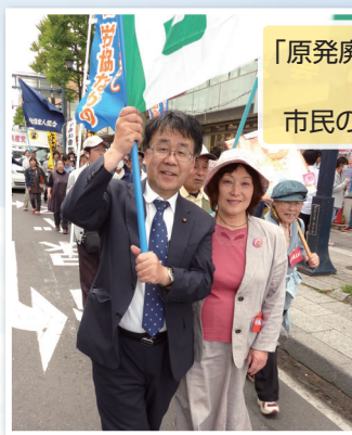
「原発廃止・再稼働反対」 の運動を 市民のみなさんと共に