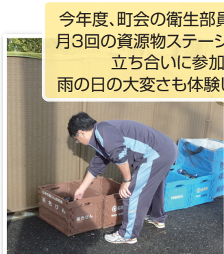
今年度、町会の衛生部員として、 月3回の資源物ステーションでの 立ち合いに参加。 雨の日の大変さも体験しました。