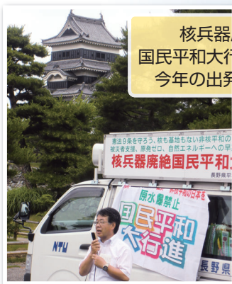
核兵器廃絶 国民平和進行 30年 今年の出発式にて