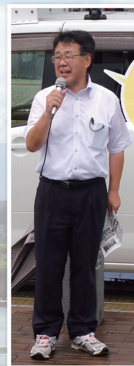
今年2月から日本共産党 中信地区委員長に就任。 衆議院長野2区全域に 責任を負っています。