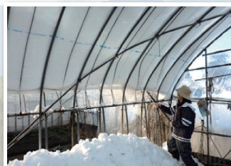
今年2月の豪雪害の被害調査のため、 農家の方と懇談。議会できりあげ、 ハウス助成策が実現しました。